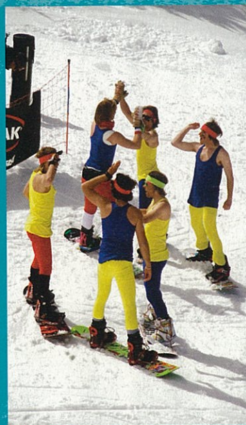
Team Fluofun.