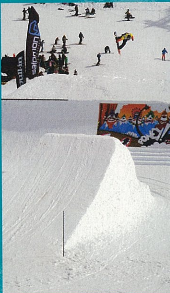
Coin Coin sur le gap de la Poney

Tu les as ratés ? Onboard y était... Petite virée sur les meilleurs événements de la fin de saison.