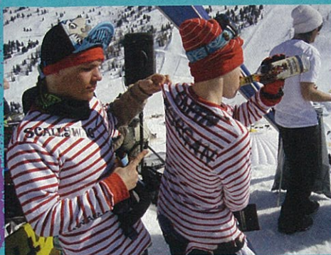
Korpela et Morgan du team Scallywag.